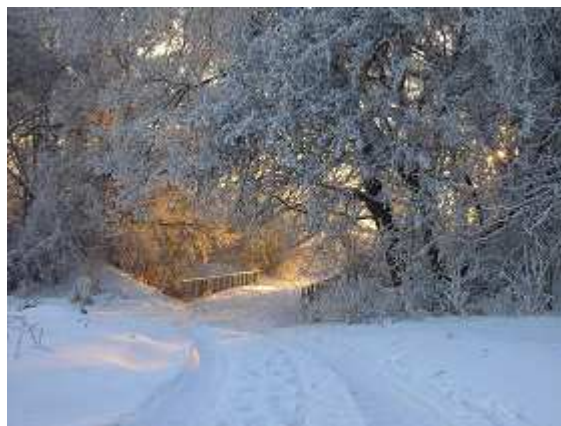
Zima w Raszowie