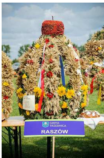
Wieniec dożynkowy – II miejsce w plebiscycie 2012 r.