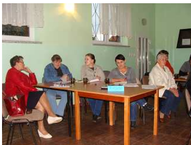
Grupa Odnowy Wsi Raszów