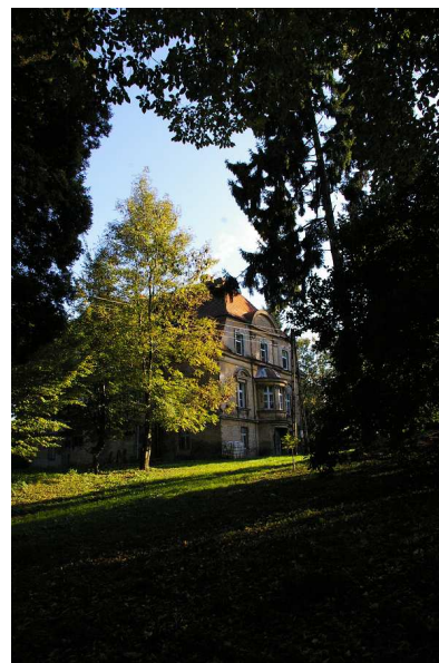
Pałac w Raszowie