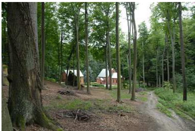
Las bukowy w Raszowie