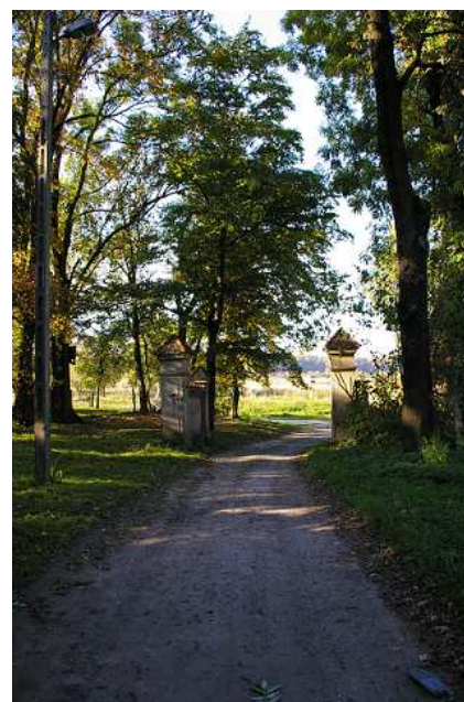
Dawna brama wjazdowa do parku