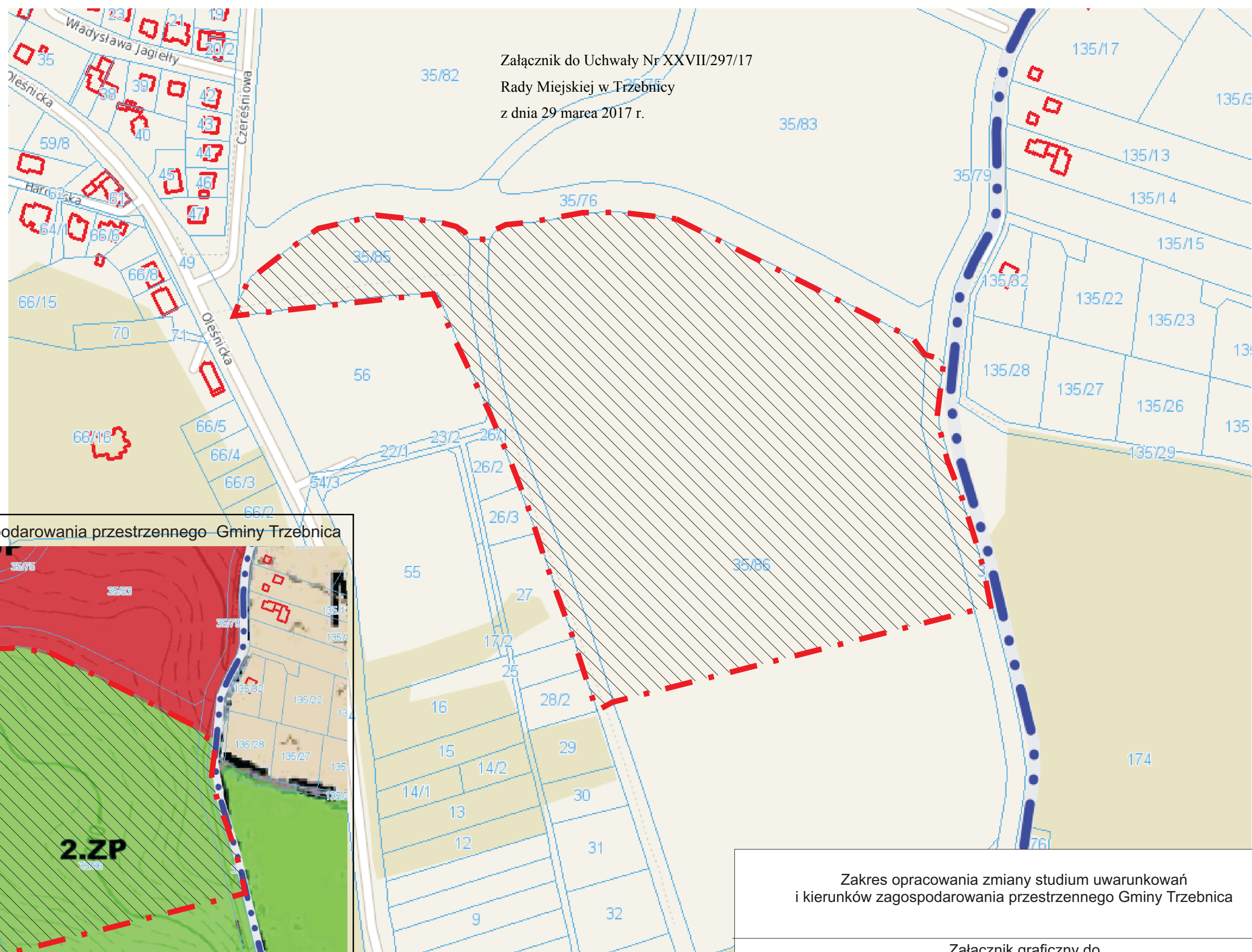
Studium uwarunkowań i kierunków zagospodarowania przestrzennego Gminy Trzebnica

Załącznik do Uchwały Nr XXVII/297/17 Rady Miejskiej w Trzebnicy z dnia 29 marca 2017 r.